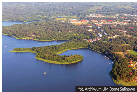
fol. Archiwum UM Borne Sulinowo

Miasto i Gmina Borne Sulinowo staje się turystyczną perłą Pomorza Zachodniego. Turystów przyciągają atrakcyjne przyrodniczo i turystycznie tereny, specyficzna historia gminy i związana z nią atmosfera tajemniczości.