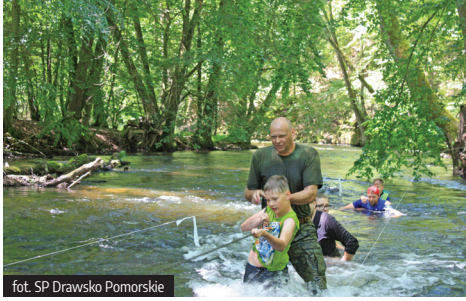
fol. SP Drawsko Pomorskie