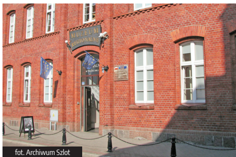
fol. Archiwum Szlot

Pomorskiego i II Wojny Światowej”, które dynamicznie się rozwija. Co roku na przełomie lipca i sierpnia odbywa się tu dwudniowy piknik historyczny, z wystawami eksponatów muzealnych. Zwieńczeniem imprezy jest inscenizacja militarno-historyczna, odzworowująca zdobycie bunkra B-Werk. Jest to wyjątkowe i bardzo widowiskowe wydarzenie.