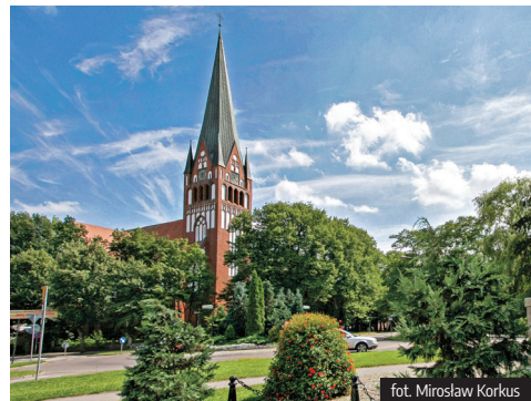
fol. Mirosław Korkus

Jest to neogotycka świątynia, wzorowana na gotyku północnoniemieckim zbudowana z cegły w latach 1905-1908, według projektu architekta Oskara Hofsfelda jako kościół ewangelicki pw. Św. Mikołaja (Neue Nikolai Kirche). Jego okazała i potężna bryła odznacza się lekkością, uzyskaną poprzez zastosowanie strzelistych okien, a także ostrołukowych ornamentów szczytów transeptu. Korpus świątyni, spięty na zewnątrz wysokimi przyporami, zamyka od strony wschodniej sześcioboczne prezbiterium, ujęte po bokach niskimi aneksami, a od zachodniej wysmukła,