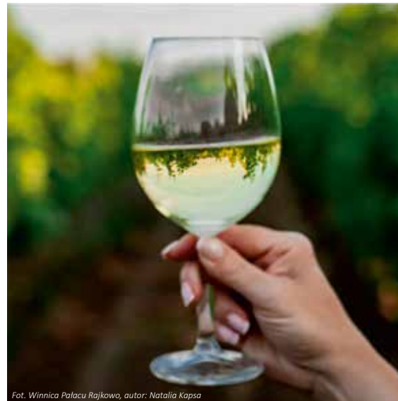
Fot. Winnica Pałacu Rajkowo, autor: Natalia Kapsa

Західнопоморські виноробні зазвичай пропонують послуги з вивчення та огляду визначних пам'яток: дегустацію, організацію заходів та продаж вина. Власники виноградників також раді поділитися знаннями про виноробство та виробництво вина. Окрім того вони пропонують житло розташоване на території, або поблизу. Західнопоморські виноробні вирощують білий і червоний виноград таких сортів, як: Каберне Кортіс, Шардоне, Гіберналь, Йоханнітер, Піно Нуар, Регент, Ріслінг, Рондо, Сейвал Блан і Соляріс. Ці сорти використовуються для виготовлення ароматних, негазованих (солодких і сухих) та ігристих вин.