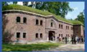
Укріплення, фортифікаційні споруди