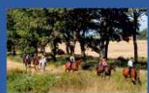
Центри кінного спорту