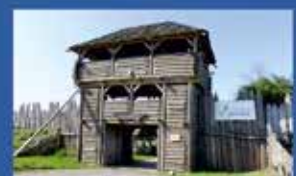
Найкращі туристичні товари