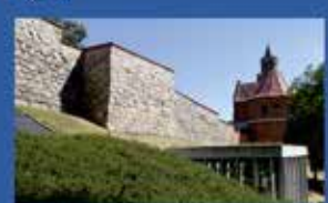
Середньовічні оборонні системи