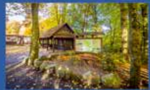
Місця паломництва, святі гори