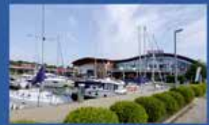
Вітрильні порти та пристані для яхт