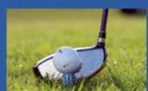
Поля для гольфу